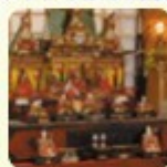
※昨年のひな祭り風景

今年も、旧仙南堂薬店さん、旧丸木商店さんや、多くの方々のご好意とご支援をいただき開催の運びとなりました。伝統と新しさの融合した、なごやかで華やかな「ひな祭り」を、まちの誇りであり趣のある景観重要建造物の「蔵」でお楽しみください。